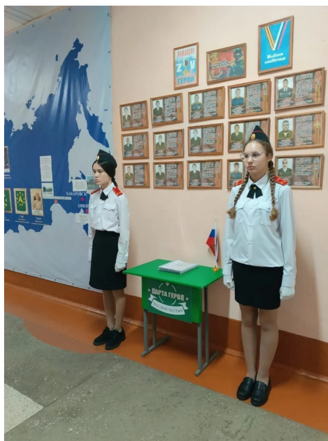
День Памяти о выпускниках МБОУ ООШ №3 г.Бикина, отдавших жизнь в ходе СВО